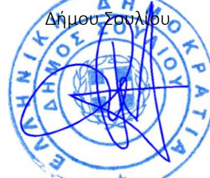
Παππάς Γρηγόριος Περιβαλλοντολόγος

Ο Προϊστάμενος Δ/νσης Τ.Υ. Περιβάλλοντος & Πολ/μίας Δήμου Σουλίου